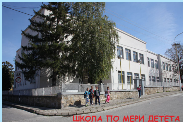
ШКОЛА ПО МЕРИ ДЕТЕТА